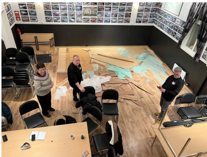
Da var de i gang med rivingen!