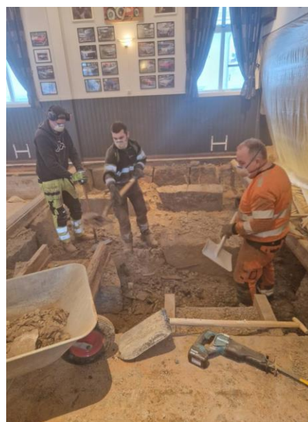
«Det støver ikke så ille» var det en som sa.. Men jo, masker måtte på!!